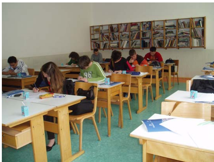
Učenici rješavaju složene zadatke