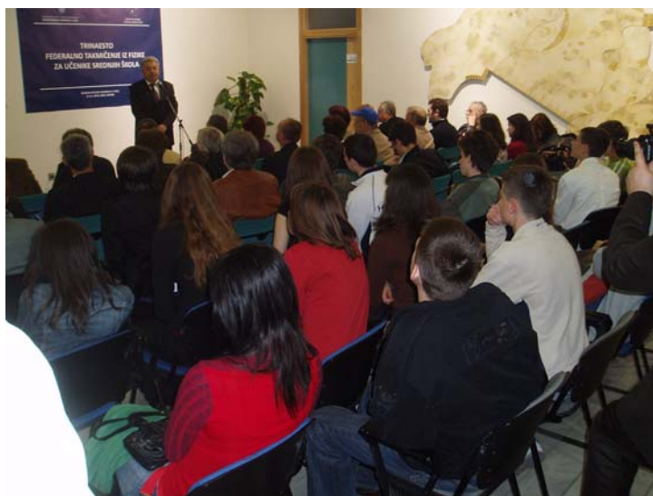
Obraćanje predstavnika Federalnog ministarstva obrazovanja i povećani iznos nagrada veoma je obradovao takmičare